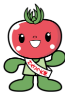
けんこう大使 とまちちゃん

◎ 北本市では、人間ドック検診等補助制度とは別に、毎年6～9月に、埼玉県後期高齢者医療加入者にご利用いただける生活習慣病予防のための「健康診査」を実施しています。対象の人には、事前に受診券をお送りしています。詳しくは、担当までお問い合わせください。