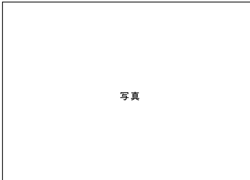
①方向 (道路側) からの写真